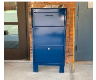
Blue Mailbox Located in 75 Walsh Rd.