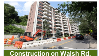
Construction on Walsh Rd.